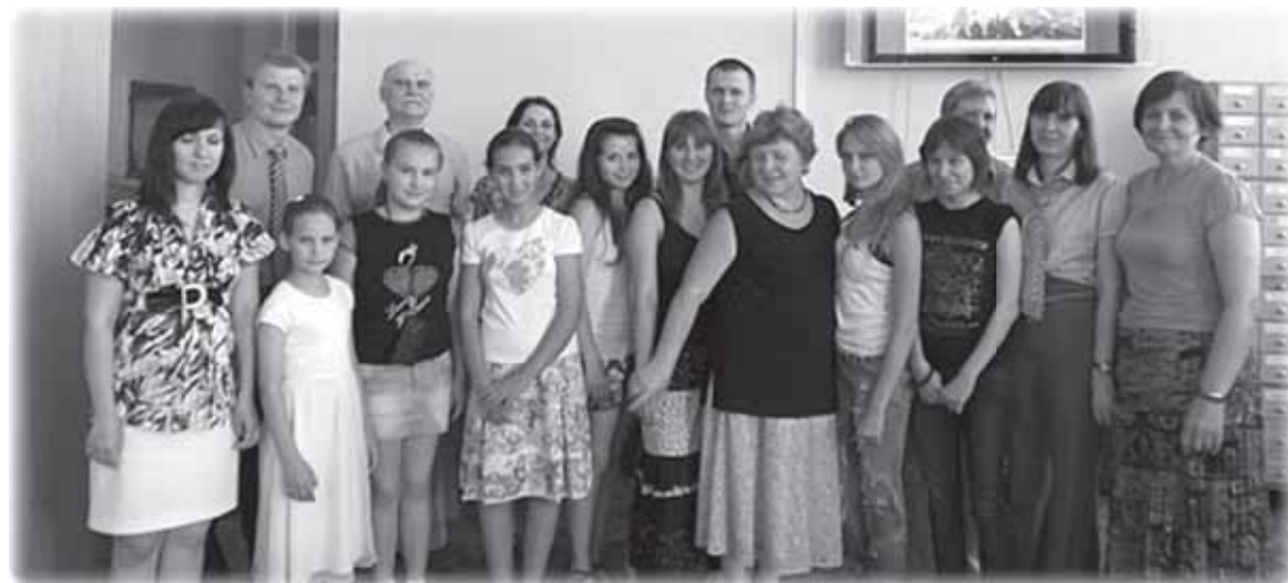
Награждение участников конкурса книжных иллюстраций в ЛОУНБ

персонажи». Виртуальная выставка знакомила посетителей сайта с памятниками чеховским героям. Их, к слову, создано до обидного мало, а ведь это – дань уважения к творческому наследию великого писателя.