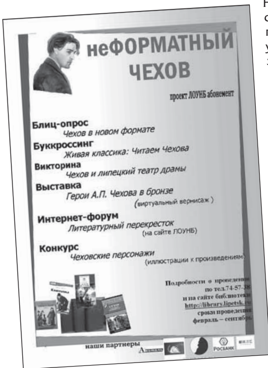
Плакат к проекту

Самым оригинальным культурным форматом проекта стал ИЗОБРАЗИТЕЛЬНЫЙ . Он включал виртуальную выставку «Герои Чехова в бронзе» (её можно увидеть на нашем сайте), и конкурс книжных иллюстраций «Чеховские