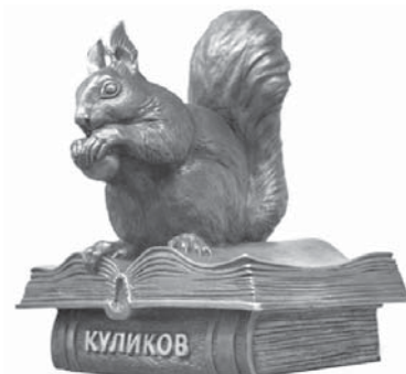
Литературный бренд Кургана

Участвуя в конкурсах, библиотеки получают и подарки: Целинная МЦБ награждена ценным подарком – ламинатором по цене 3400 руб. за призовое место в патриотическом марафоне «Имя земляка» на сайте «Память Зауралья». В Шумихинской ЦРБ благодаря участию в област-