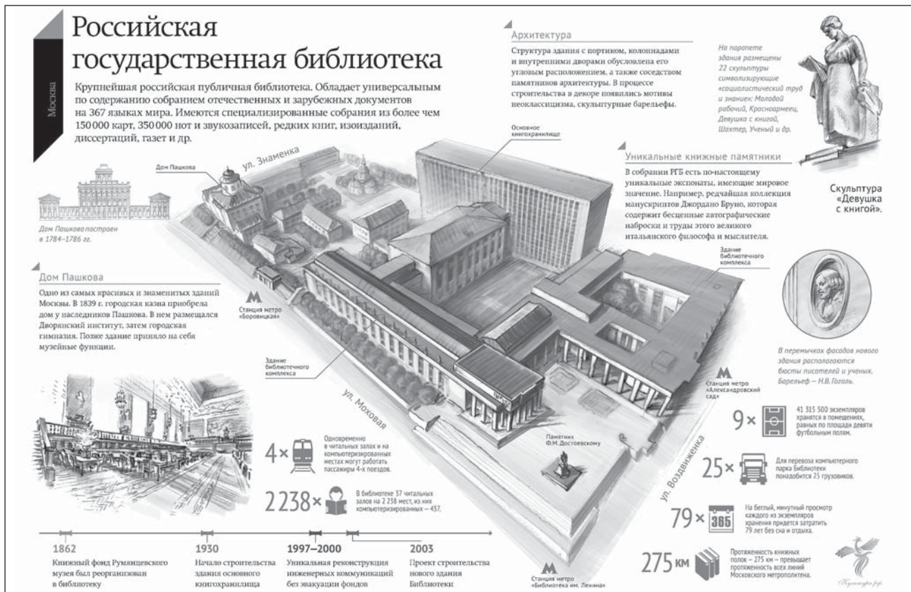
Рис. 2. Здание РГБ

Надо отметить, что создание подобного продукта – это коллективная работа, требующая немалых творческих усилий. Однако полученный результат того стоит. Изучая сайты библиотек России, я практически не встречала примеры использования инфографики. Исключение составили РГБ и Российская государственная библиотека для молодёжи. Очевидно, этот инструмент ещё плохо освоен в нашем профессиональном сообществе. Однако достоинства инфографики налицо, и перспективы у данного направления есть. Надеемся, что в ближайшем будущем библиотекари научатся работать с этой формой подачи информации и подобных продуктов станет значительно больше.