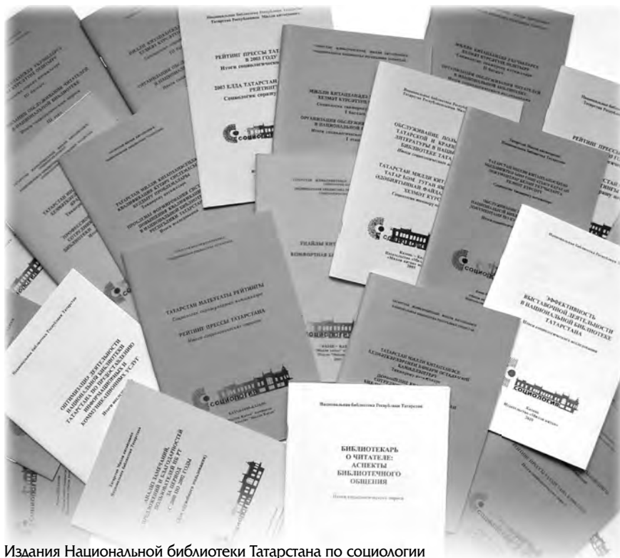
Издавания Национальной библиотеки Татарстана по социологии