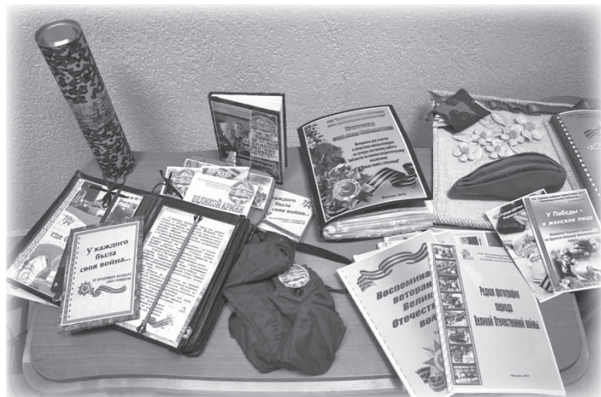
Выставка конкурсных работ «Живая память поколений»