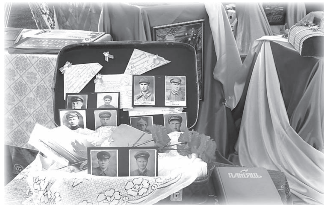
Экспозиция «Прикоснись к истории», с. Круглое

Активное участие молодых людей в конкурсах и викторинах, организованных библиотеками в рамках 70-летия освобождения Беларуси от немецко-фашистских захватчиков и 70-летия Победы, объясняется их возрастными особенностями и азартом. В районном литературном конкурсе «Пера волшебнае творенне» Климовичской ЦРБ приняли участие более 30 молодых поэтов и прозаиков района. Произведения самодельных поэтов Кировска вошли в отдельный сборник. Творческую инициативу молодых дрибинчан стимулировал районный смотр-конкурс на лучшее выразительное чтение «Под салютом всеобщей Победы». Похожий конкурс организовала и Шкловская РДБ. Участники конкурса сочинений, проведённого Костюковичской РДБ, встречались с ветеранами войны и записывали их