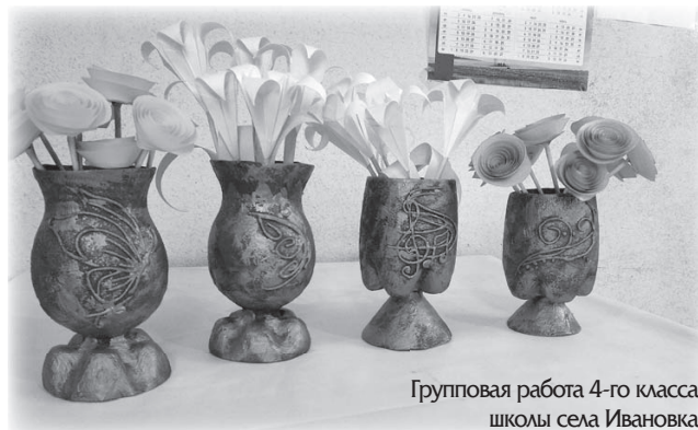
Групповая работа 4-го класса школы села Ивановка