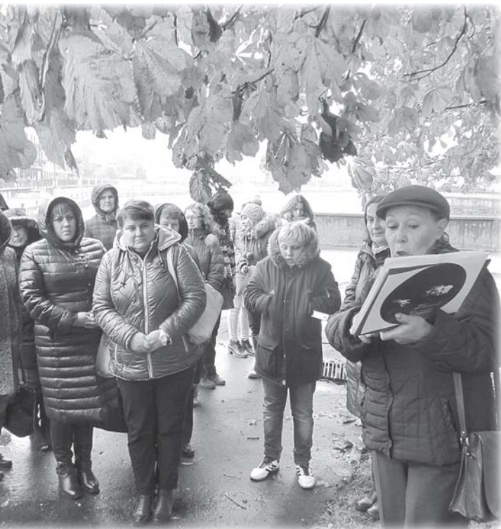
Городская библиотека г. Зеленоградска. Литературная экскурсия

Дни литературы в Калининградской области – крупнейший культурный форум региона, который проводится с 2001 г. Среди мероприятий форума: литературные акции, творческие встречи с писателями и издателями, выставки и презентации книг, беседы, конференции, литературные вечера и вечера памяти, а также концерты и спектакли по произведениям русской литературы.